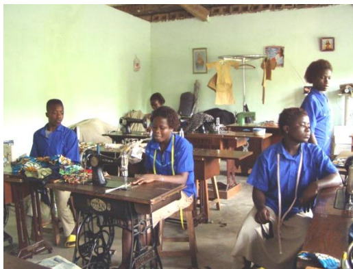
Lehrlinge in der Schneiderei

Mit Unterstützung der Fa. Iffland, mit Hauptsitz in Stuttgart, wurde seit 2016 ein Zentrum für Schwerhörige im Kreiskrankenhaus in Kpalime eingerichtet. Dort werden Menschen mit Hörgeräten versorgt.